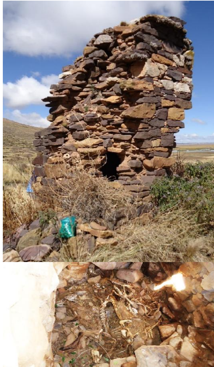
Figura 2.- Chullpa o torre funeraria prehispánica que contiene en su interior ofrendas de perros actuales, sitio arqueológico Chullpería, Pucarani.

tafonómicos. Asociados a estos se observan hojas de coca esparcidas al interior de la chullpa , la misma en su parte externa está a punto de colapsar, se observa una inclinación muy severa y se nota que cayeron muchos de los sillares que componen su estructura, presenta un pequeño ingreso a modo de puerta y su planta es de forma semicircular. Cinco de los siete cuerpos de los perros se encuentran con piel.